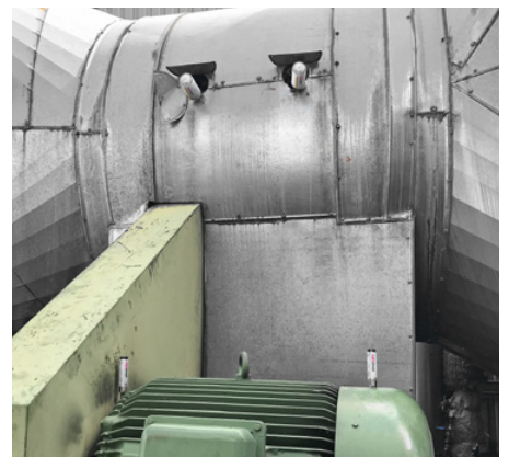
Lubrification des paliers d'un système de ventilation avec simalube 125 ml et 15 ml.