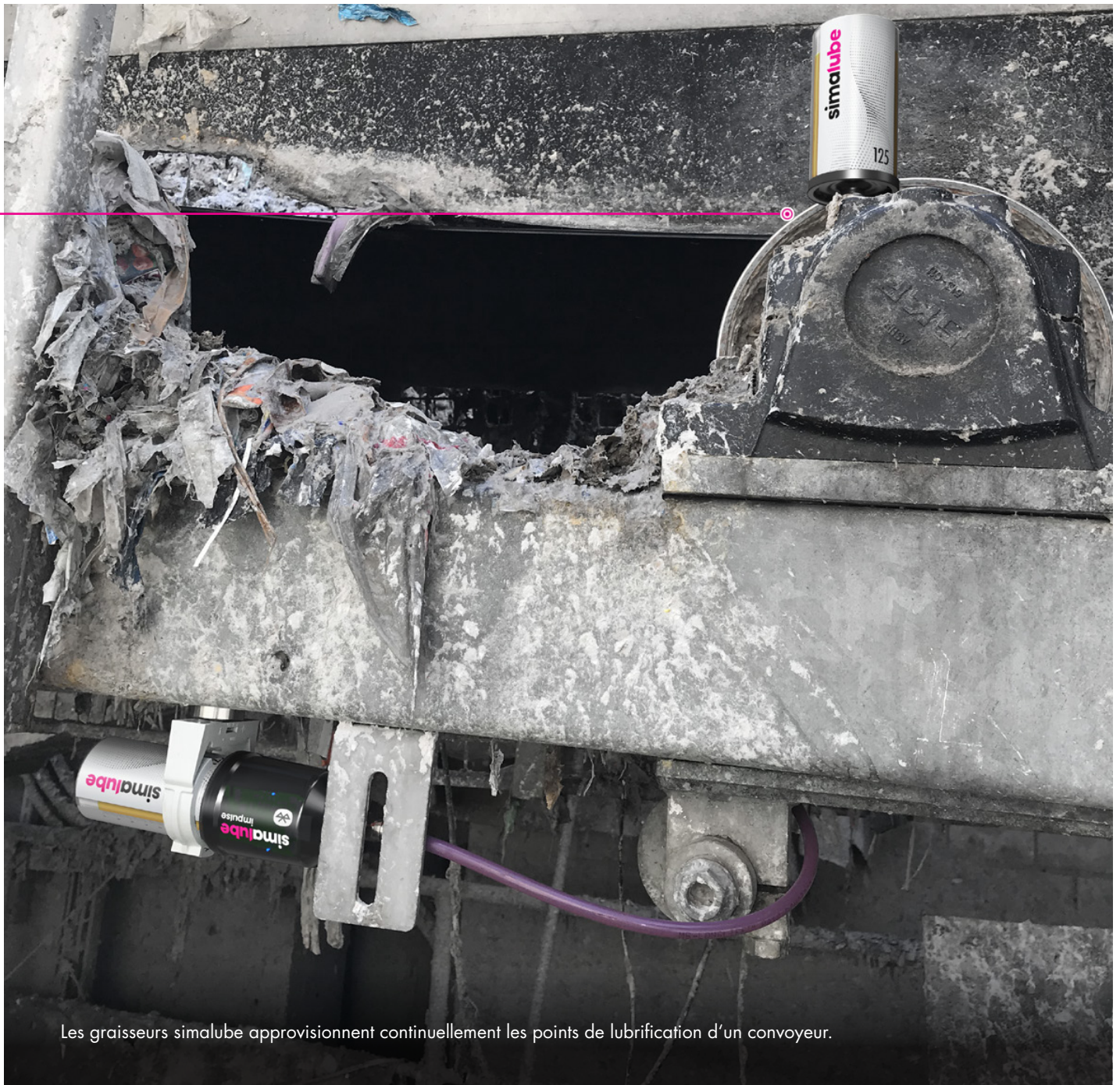
Les graisseurs simalube approvisionnent continuellement les points de lubrification d'un convoyeur.