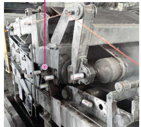
Varios simalube de 125 ml lubrican el rodamiento de una máquina de papel de forma automática y precisa.