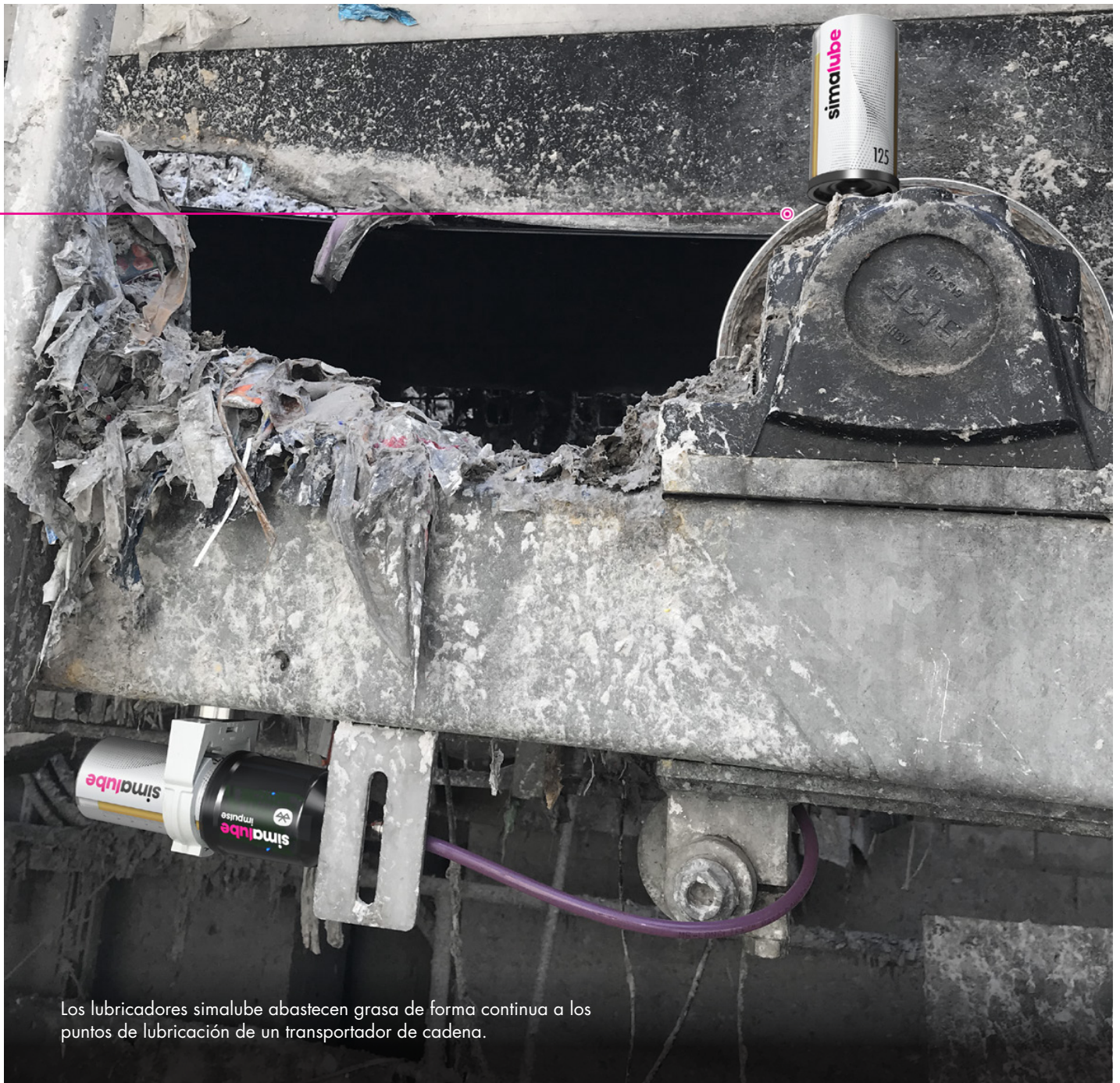
Los lubricadores simalube abastecen grasa de forma continua a los puntos de lubricación de un transportador de cadena.