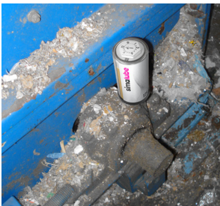
En una fábrica de papel, se lubrica el soporte con rodamiento de una trituradora con un simalube de 125 ml.

«Ahorro considerable de tiempo y mejora de la seguridad operativa gracias a la lubricación automática»