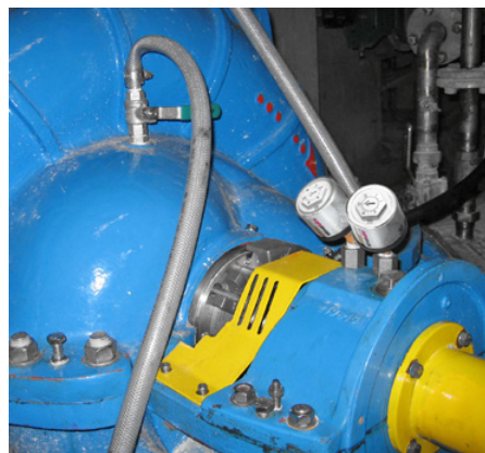
El rodamiento de una bomba se lubrica con dos simalube de 30 ml.