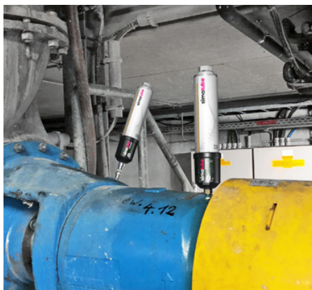
El rodamiento de la bomba se lubrica con dos IMPULSE y simalube de 250 ml.